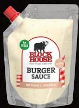
Burger Sauce Classic Art.-Nr. 15578 Inhalt 250 ml