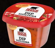
Dip Siziliana Art.-Nr. 15630 Inhalt 200 g