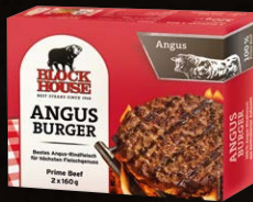
Angus Burger Art.-Nr. 15415 Inhalt 2x 160 g