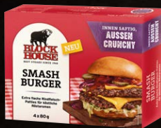
Smash Burger NEU Art.-Nr. 15446 Inhalt 4x 80 g