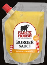
Burger Sauce Cheese Art.-Nr. 15512 Inhalt 250 ml