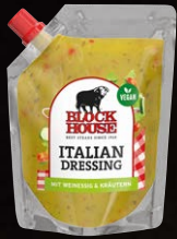
Italian Dressing Art.-Nr. 15567 Inhalt 250 ml