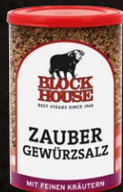
Zauber Gewürzsatz, Dose Art.-Nr. 15107 Inhalt 280 g