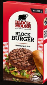
Block Burger Art.-Nr. 23103 Inhalt 2x 200 g