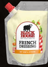
French Dressing Art.-Nr. 15563 Inhalt 250 ml