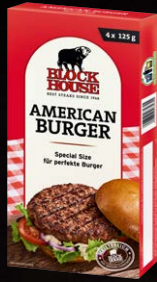
American Burger Art.-Nr. 23102 Inhalt 4x 125 g