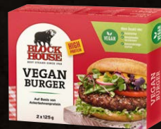
Vegan Burger VEGAN Art.-Nr. 15434 Inhalt 2x 125 g