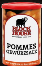
Pommes Gewürzsatz, Dose Art.-Nr. 15097 Inhalt 280 g