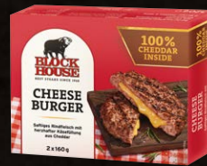
Cheese Burger Art.-Nr. 15441 Inhalt 2x 160 g