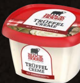
Trüffel Creme Art.-Nr. 11059 Inhalt 200 g