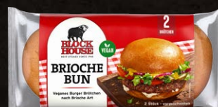
Brioche Bun Art.-Nr. 15519 Inhalt 2x 80 g