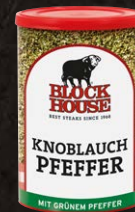
Knoblauch Pfeffer, Dose Art.-Nr. 12159 Inhalt 200 g