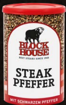
Steak Pfeffer, Dose Art.-Nr. 12154 Inhalt 200 g