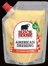
American Dressing Art.-Nr. 15564 Inhalt 250 ml