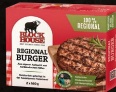
Regional Burger Art.-Nr. 15424 Inhalt 2x 160 g