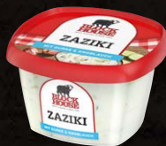
Zaziki Art.-Nr. 11067 Inhalt 200 g