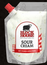
Sour Cream Art.-Nr. 11055 Inhalt 250 g