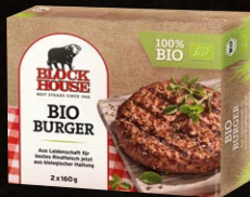
Bio Burger Art.-Nr. 15440 Inhalt 2x 160 g