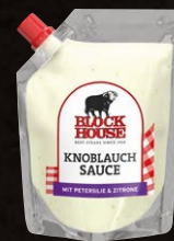
Knoblauch Sauce Art.-Nr. 15572 Inhalt 250 ml