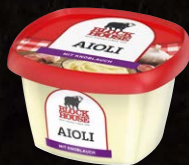
Aioli Art.-Nr. 11060 Inhalt 200 ml