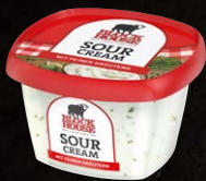
Sour Cream Art.-Nr. 11056 Inhalt 200 g