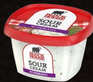
Sour Cream Knoblauch Art.-Nr. 11057 Inhalt 200 g