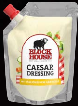
Caesar Dressing Art.-Nr. 15584 Inhalt 250 ml