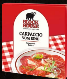
Carpaccio Art.-Nr. 21019 Inhalt 2x 80 g