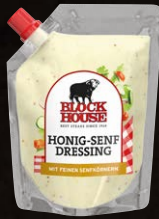
Honig-Senf Dressing Art.-Nr. 15509 Inhalt 250 ml